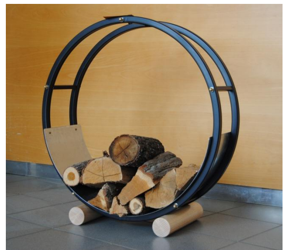
Kaminholz-Regal (Ø 700 mm)