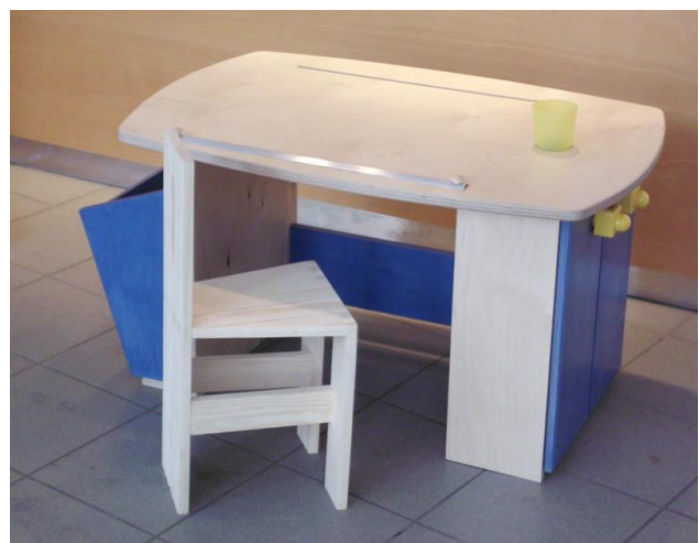
Kindermaltisch (53 x 95 x 65 cm)