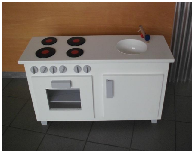
Kinderküche (53 x 90 x 30 cm)

An unserem Basar am 30. Mai von 11.00 Uhr – 17.00 Uhr können sie sich von der hohen Qualität der Arbeiten überzeugen und diese natürlich auch kaufen.